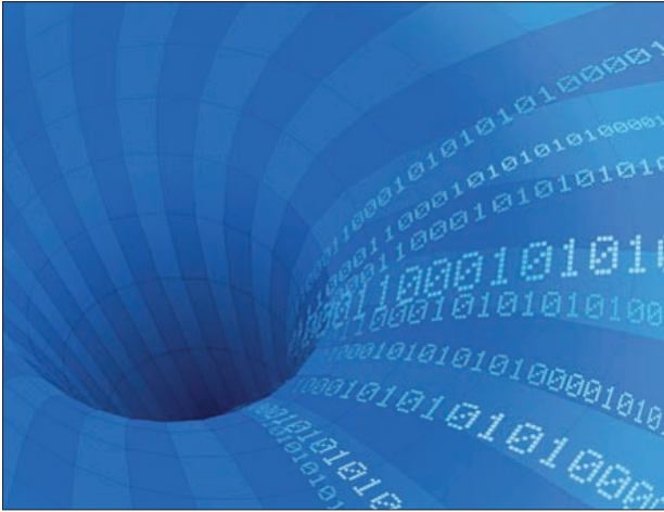
Figura 2. http://historyofeconomics.files.wordpress.com/

servir para mejorar el servicio de todos los abonados y no sólo para retener al descontento.