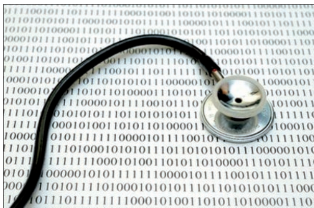
Figura 1. http://www.ucam.edu/informatica/

ello en general debe escribir una carta y enviarla por correo a la sede de la empresa, y esto implica cultura, tiempo y gasto. El código de ética –quedado visto una vez más– es necesario.