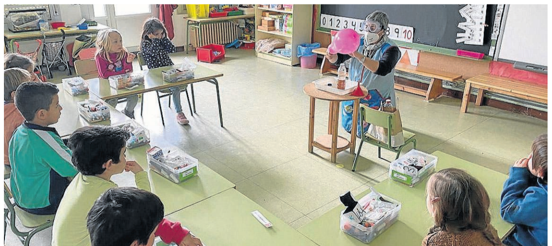
Los escolares de infantil participaron en varios experimentos científicos. CPI RAMÓN Y CAJAL

Para conmemorar el Día Internacional de la Mujer y la Niña en la Ciencia, el pasado 11 de febrero, en el CPI Ramón y Cajal de Ayerbe (Huesca) desarrollamos una serie de propuestas científicas para recordar que en la ciencia, al igual que en cualquier ámbito de la vida, el género no debe ser una barrera. Los más pequeños realizaron experimentos, como el de