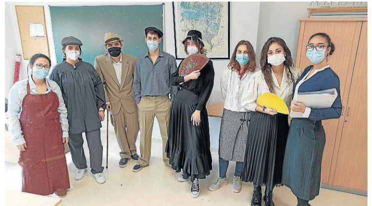
Los alumnos, durante uno de los ensayos. CPIFP SAN LORENZO

Visitas turísticas teatralizadas, con mujeres que hicieron historia como protagonistas, la apuesta de los alumnos del CPIFP San Lorenzo de Huesca